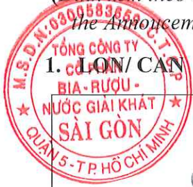
MẶT TRƯỚC/ FRONT

(Đính kèm theo Thông báo bổ sung nội dung Bản tự công bố sản phẩm ngày 06/10/2023/ Attached with the Announcement of additional of the Certificate of Self-Declaration dated on October 6 th , 2023)